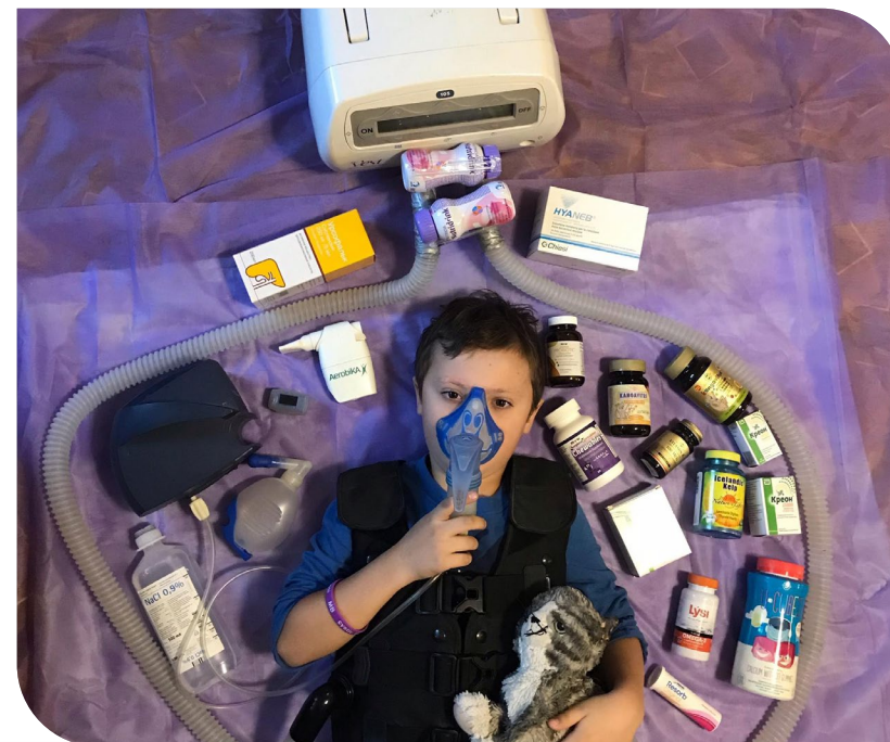
Аппарат искусственной вентиляции легких для подопечного фонда «Во имя жизни».

Банк также оказал поддержку фонду помощи детям с тяжелыми заболеваниями печени «Жизнь как чудо» . Средства в размере 320 000 рублей были направлены на реализацию программы «Помощь больнице» по обеспечению региональных клиник инновационными аппаратами для диагностики гипераммониемии новорожденных. Реализация программы позволит сохранить жизнь многих новорожденных с наследственными болезнями обмена веществ и уменьшить детскую инвалидизацию. Программа реализуется совместно с отделом педиатрии ФГБУ «Национальный медицинский исследовательский центр акушерства, гинекологии и перинатологии им. В.И. Кулакова» Минздрава России и направлена на улучшение ранней диагностики и выявление причин развития тяжелых патологических состояний у новорожденных детей, ассоциированных с повышенным уровнем аммиака в крови.