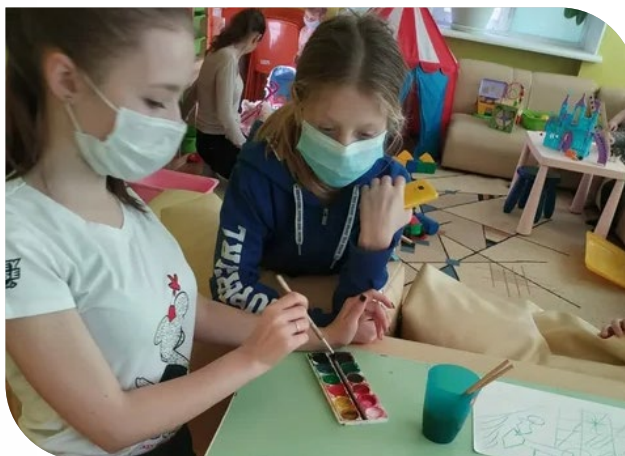
Новогоднее представление в Психоневрологической больнице для детей с поражением ЦНС с нарушением психики.