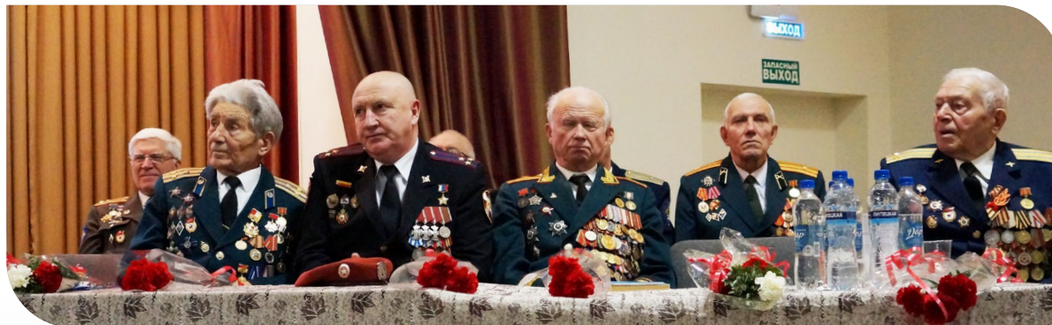
Праздничное мероприятие для ветеранов в Российском общественном благотворительном фонде ветеранов (пенсионеров) войны, труда и Вооруженных Сил.

На протяжении нескольких лет ЮниКредит Банк помогает ветеранам, выделяя средства на материальную помощь и организацию мероприятий для ветеранов в связи с праздниками День Победы, Новый год и юбилеями военных событий. В 2020 году Банк оказал благотворительную помощь фондам, поддерживающим ветеранов войны и пожилых людей в размере 450 000 рублей. В декабре 2020 года сотрудники Банка также приняли участие в традиционной предновогодней акции благотворительного фонда «Старость в радость» и перечислили пожертвования в размере 104 000 рублей на новогодние подарки для одиноких пожилых людей.