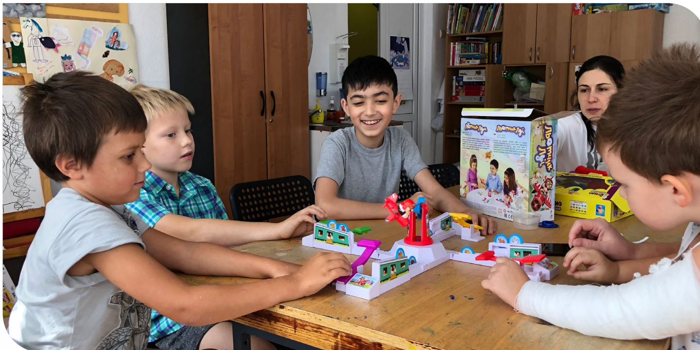
Игровая комната. Ожоговый центр при больнице им. Г. В. Сперанского.

Арт-терапия играет важную роль в процессе выздоровления детей. Ход лечения, как известно, во многом связан с психоэмоциональным состоянием ребенка. С детьми занимаются опытные психологи. В занятиях используются самые разные техники арт-терапии – рисование красками, карандашами, мелками, работа с глиной, перчаточными куклами, музыкальными инструментами, сочинение историй. Арт-терапевтические занятия позволяют снять механизмы психологической защиты ребенка с тяжелыми хроническими заболеваниями и получить возможность контакта с его чувствами.